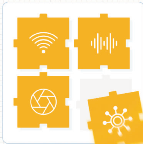
Bild 1 | Die modulare Embedded-Designplattform besteht aus FPGA-basierten SoMs und individuellen Mainboards, die aus derzeit über 45 Building Blocks frei konfiguriert werden können.